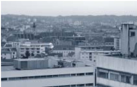
Abbildung 3: Grazer Dachlandschaft, Ausschnitt

(1) Im Schutzgebiet (§ 2) ist beim Wiederaufbau abgebrochener Bauten sowie bei der Verbauung von Baulücken und sonst unverbauter Grundstücke den Bauten eine solche äußere Gestalt zu geben, dass diese sich dem Erscheinungsbild des betreffenden Stadtteiles einfügen; dasselbe gilt für Bauveränderungen sowie für Zu- und Umbauten bestehender Bauten. Portale und Schaufenster haben im Ausmaß ihrer Öffnungen die tragende Funktion der Außenmauern klar erkennen zu lassen.“