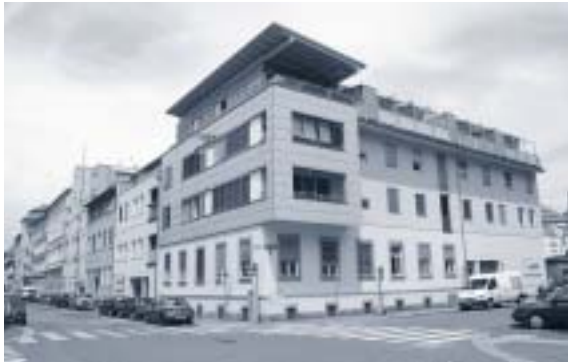
Abbildung 18: Aufstockung Kastelfeldgasse