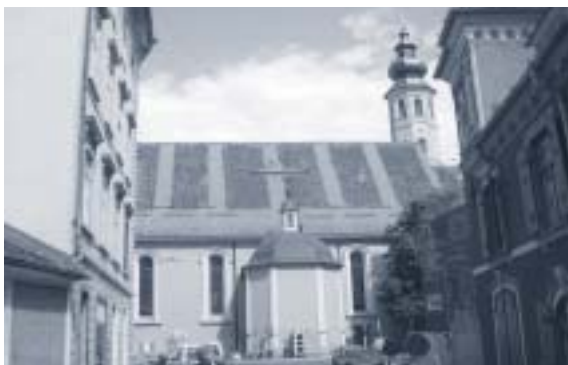
Abbildung 11: Andräkirche

Die Längserstreckung von Langhaus und Chor beträgt ca. 53,0 m.