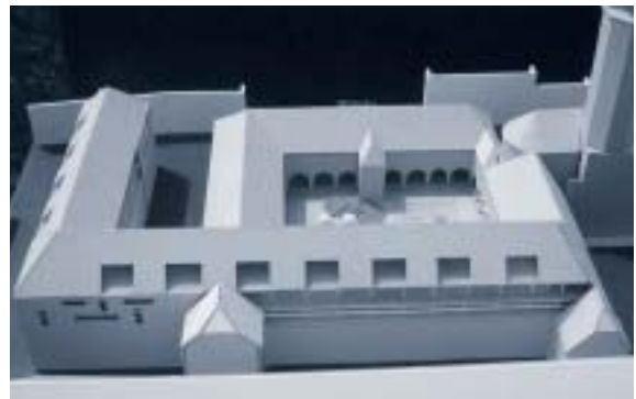
Abbildung 4: Modell Satteldach

Im Jahr 2002 wird das Projekt „Sanierung und Neubau Dreihackengasse 1-3“, ehemaliges Dominikanerkloster, Graz, in einem Grazer Architekturbüro (Name dem Autor bekannt) konzipiert. Betreffend Dachausbildung des aufzustockenden Gebäudeteiles (Ostrakt) wird ein Kompromiss mit Denkmalamt, ASVK, Stadtplanung, Stadtbaudirektion und Bauherr gefunden. Eine konventionelle Satteldachlösung mit Ziegeldeckung (Abbildung 4). Das „österreichische“ Ergebnis: Keiner der Beteiligten ist so richtig zufrieden! Das Projekt wird mit Baubescheid vom 17.04.2003 – mit Zustimmung der Grazer Altstadtsachverständigenkommission – bewilligt.