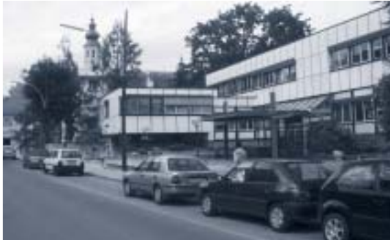
Abbildung 14: Bundesgymnasium

Hauptgebäude: Traufenhöhe: 359,7 m Dachaufbauten: Traufenhöhe: max. 364,0 m