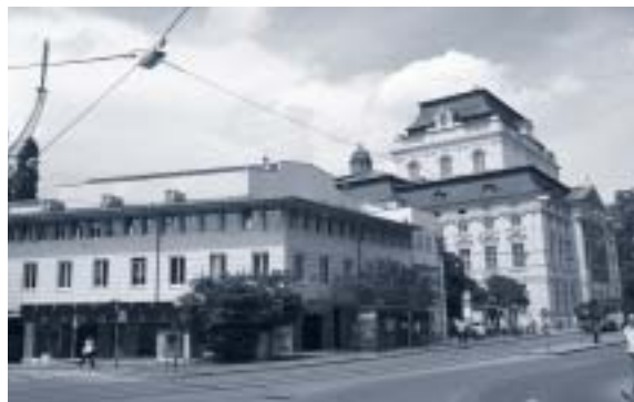
Abbildung 16: Opernhaus und Zubau

Das Opernhaus wurde in den Jahren 1898/1899 erbaut (Architekt F. Fellner) und ist ein imposanter Baublock mit einem Mansardendach im späthistorisch-neobarocken Stil, Pavillons und einer Kuppel. Der Zubau aus dem Ende des 20. Jahrhunderts besitzt ein flach geneigtes Satteldach mit einer Blechdeckung (siehe Abbildung 16).