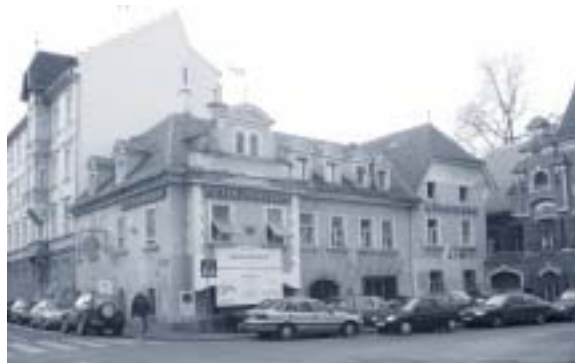
Abbildung 13: Dreihackengasse 2

Das Objekt Dreihackengasse 2 ist ein um 1900 erbautes, viergeschoßiges, achtschichtiges Zinshaus mit späthistorisch altdeutscher Fassadengliederung (siehe Abbildung 13).