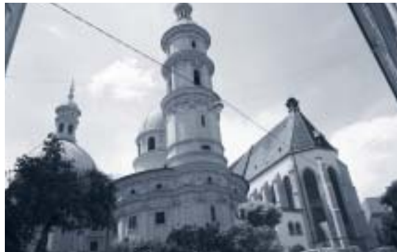
Abbildung 15: Domkirche & Mausoleum: Nebeneinander von Mittelalter und Barock

In der folgenden Fotodokumentation wird anhand einiger exemplarischer Beispiele die o.a. Gestaltvielfalt, das Nebeneinander unterschiedlicher Stilepochen dokumentiert: