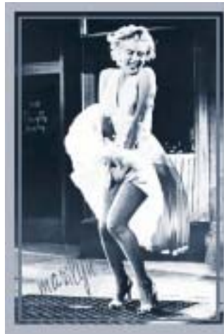
Abbildung 1: Frau

Ähnlich wie Mann ergeht es Architekten, wenn ein Wettbewerbsbeitrag nicht die Zustimmung des Preisgerichts erhält,