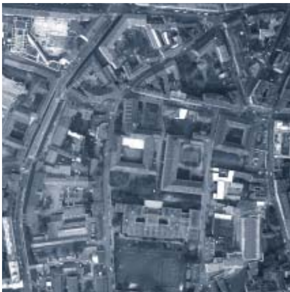
Abbildung 7: Luftbild Bezirk Gries

Das bestehende Gebäude, das ist das (ehemalige) Dominikanerkloster wurde zwischen 1639 und 1661 errichtet. 1807 wurde das Kloster profaniert und zur so genannten „Kleinen bzw. Alten Dominikanerkaserne“ adaptiert. Vermutlich wurden damals der zweiachsig in die Dreihackengasse vorspringende Anbau an der Südwestecke und die anschließende straßenseitige Umfassungsmauer abgebrochen. Die Fenster wurden nach 1800 und in jüngerer Zeit vergrößert bzw. verändert.