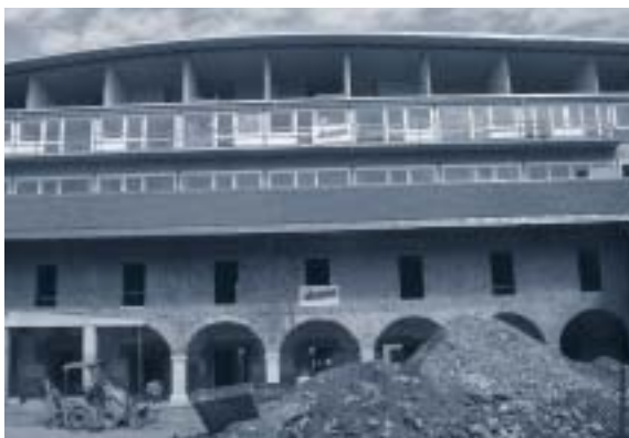
Abbildung 9: Osttrakt im Bauzustand

Im Frühjahr 2003 wurde mit den Bauarbeiten begonnen. Im Zuge der ausführenden Planung wurde das Projekt modifiziert, und im Dezember 2003 wurden die vorliegende Planung sowie eine Überarbeitung vom April 2004 zur