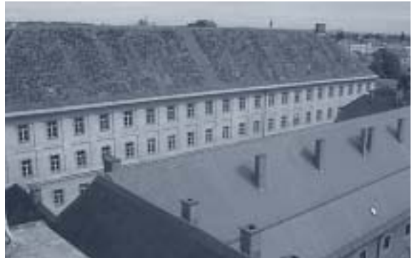
Abbildung 12: Neue Dominikanerkaserne

Westflügel: Traufenhöhe: 367,3 m Firsthöhe: 377,3 m