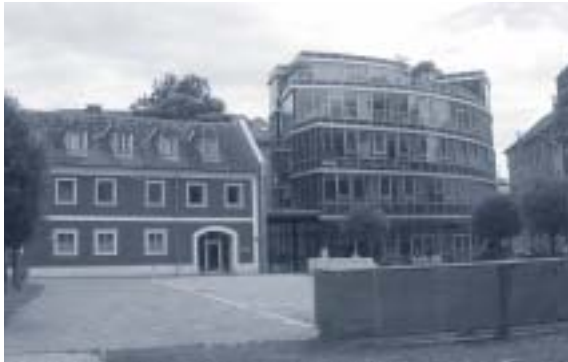
Abbildung 17: Am Entenplatz: Mittelalter versus Architektur von K. Kada