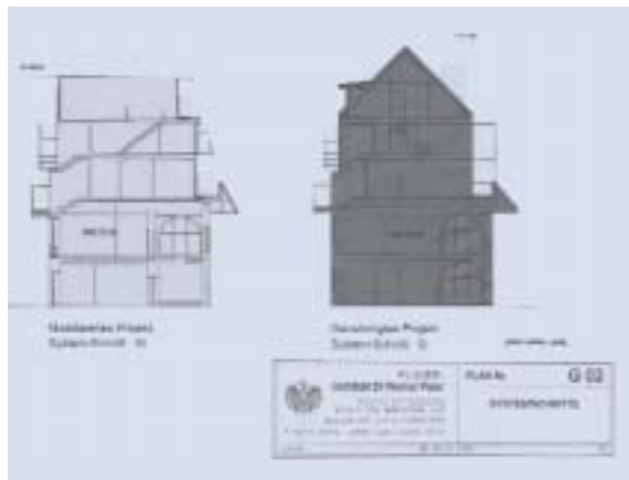
Abbildung 10: Gegenüberstellung der Projekte

Die Gesamthöhe des Osttraktes reduziert sich von 371,99 m ü.A. (alte Firsthöhe) auf max. 369,66 m (Wellenscheitel), somit um gesamt 2,33 m. Durch die Änderung der Dachform – flach geneigtes Wellendach anstatt steil geneigtes Satteldach – kommt es zu keiner Vergrößerung des Rauminhaltes, aber durch die Reduktion der Gesamthöhe zu einer Verringerung der Ansichtsfläche. Die Aufstockung wird spürbar „leichter“. Die Qualität der Wohnungen in diesem Bereich wird stark verbessert. Abbildung 10 zeigt eine Gegenüberstellung des genehmigten mit dem nunmehr geplanten Projekt.