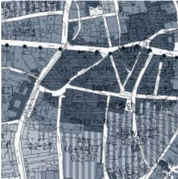
Abbildung 6: Ausschnitt aus dem Flächenwidmungsplan 2002 der Stadt Graz

tischen Fassadengliederungen vielfach abgeschlagen oder modernisiert, die Höfe größtenteils mit Werks- und Fabrikhallen verbaut. Noch um 1830 wenige kleine Häuser mit Gärten. Erst um die Mitte und in der zweiten Hälfte des 19. Jahrhunderts dichtere Verbauung.“