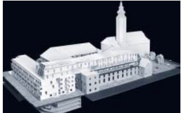
Abbildung 19: Modellfoto des ausgeführten Projekts

Mit Bescheid vom 17.04.2003 wurde die Errichtung des ursprünglich eingereichten Projektes mit Zustimmung der Grazer Altstadtsachverständigenkommission bewilligt. Die grundsätzliche Frage der Aufstockung des Osttraktes ist somit nicht Gegenstand des vorliegenden Gutachtens. Bereits die genehmigten „Proportionen“ des aufgestockten Osttraktes sind ortsüblich (siehe Befund Punkt 3.4., best. Monumentalbauten!), die Kubaturen der Andräkirche und des benachbarten Neuen Dominikanerklosters sind deutlich größer als jene des genehmigten Projektes. Die Gesamthöhen überragen das (genehmigte) Projekt deutlich!