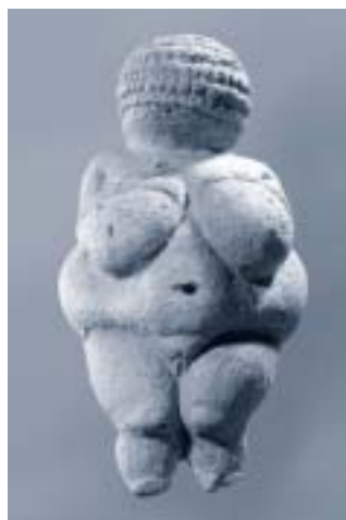
Abbildung 2: Venus von Willendorf (25.000 v.Ch.)