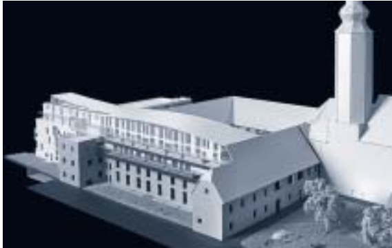
Abbildung 5: Modell Welle

mensetzung von Gremien, welche über Ortsbildschutz bzw. Altstadterhaltung usw. zu befinden haben, ist in etwa vergleichbar mit der Bildung einer Jury zum Thema „Traumfrau“.